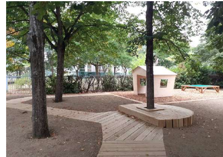
Ecole élémentaire Victor Hugo