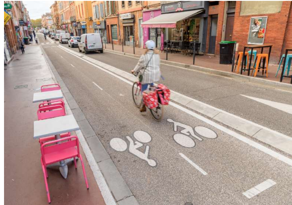
Piste cyclable éclaircie après grenailage rue de la République