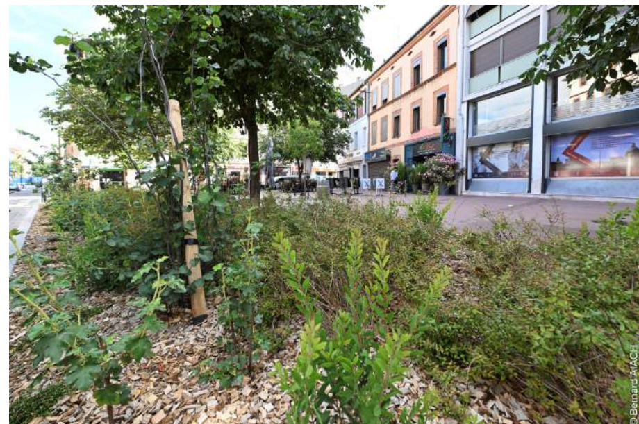
Place Bachelier, débitumisée et végétalisée en 2024

: Le seuil des 20 ha débitumisés sera atteint sur la période 2020 - 2026