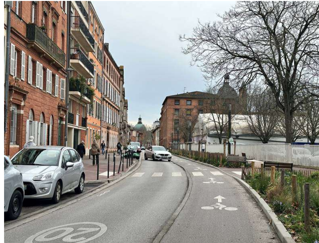
Piste cyclable éclaircie après grenailage rue Valade